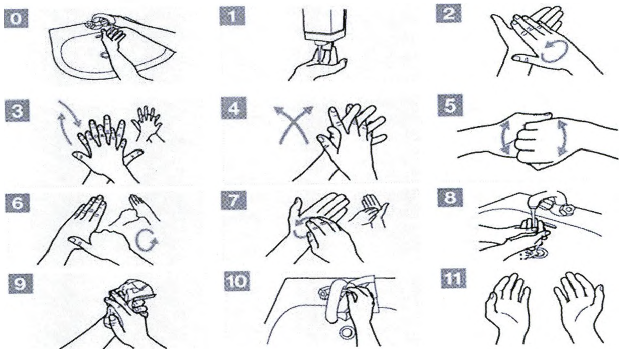
Рис. 11 – Процедура закончена

Рис.10 - Использовать полотенце для закрытия крана